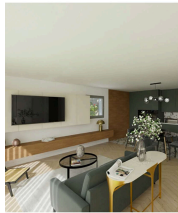
PIÈCE DE VIE